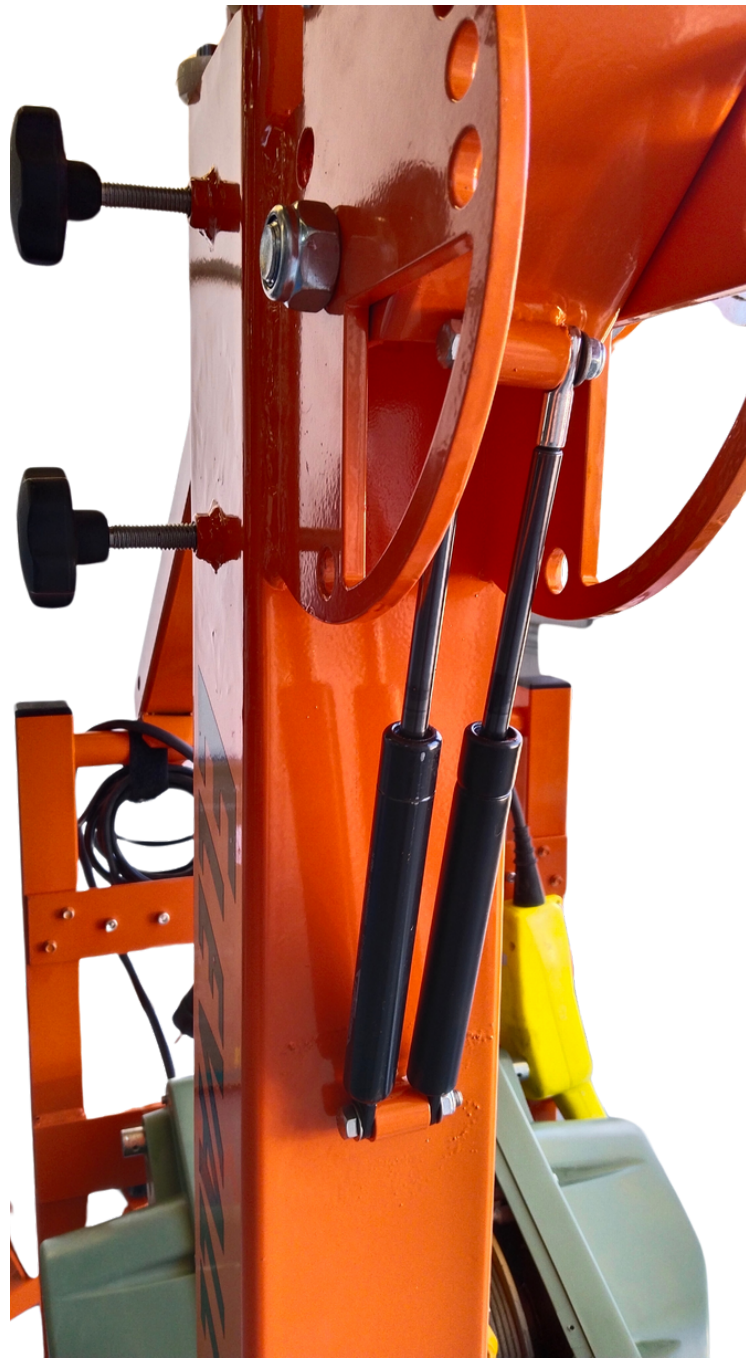
Double Brake & hidrahulic pistón Doble freno & pistón hidráulico