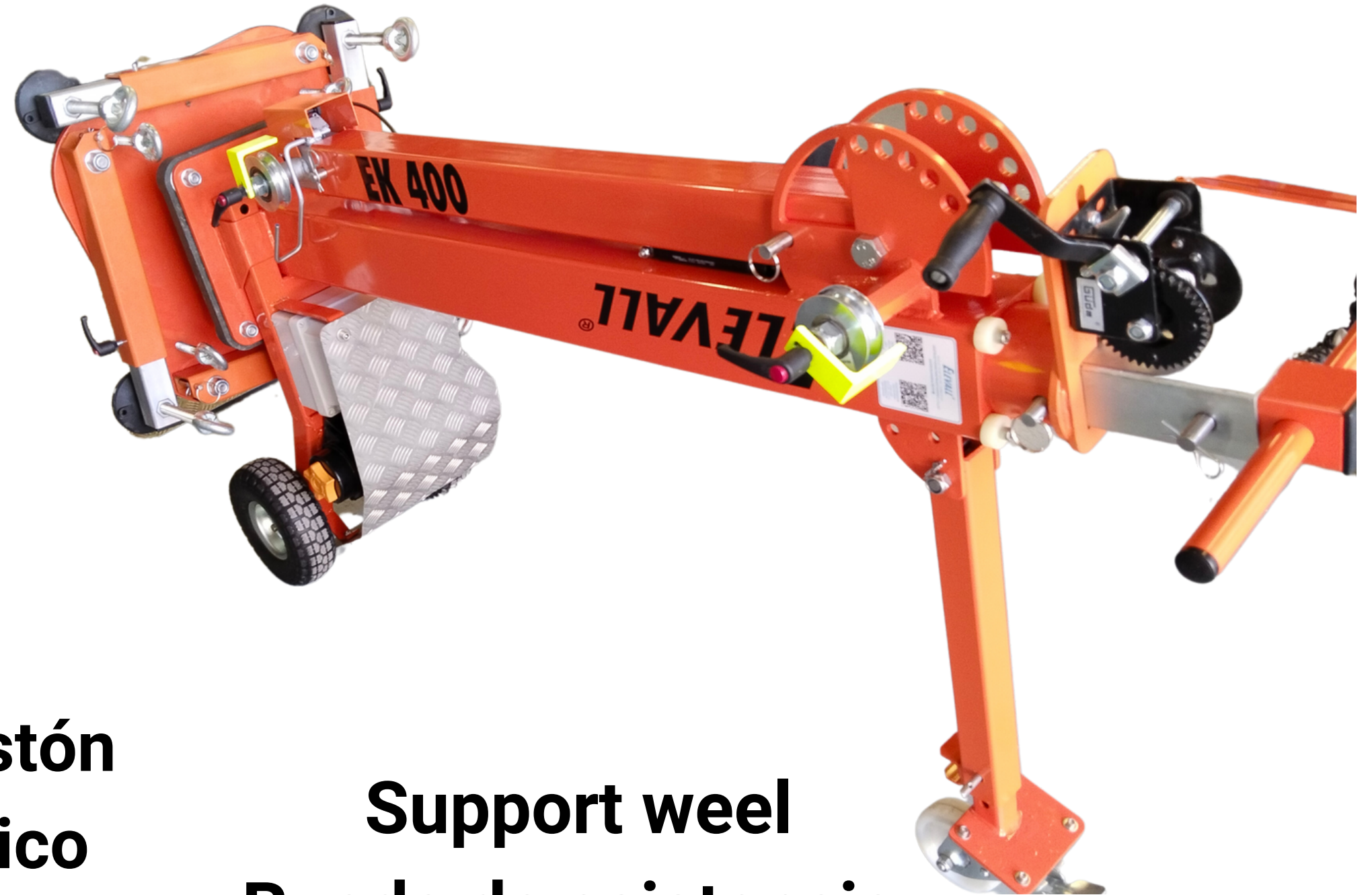
Support weel Rueda de asistencia